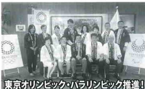
東京オリンピック・パラリンピック推進!

【発行元】自由民主党目黒区議団 〒153-8573 東京都目黒区上目黒2-19-15 【TEL】03(3715)1111 目黒区総合庁舎 自民党目黒区議団控室 自民党目黒区議団HP http://meguro-jimin.com/